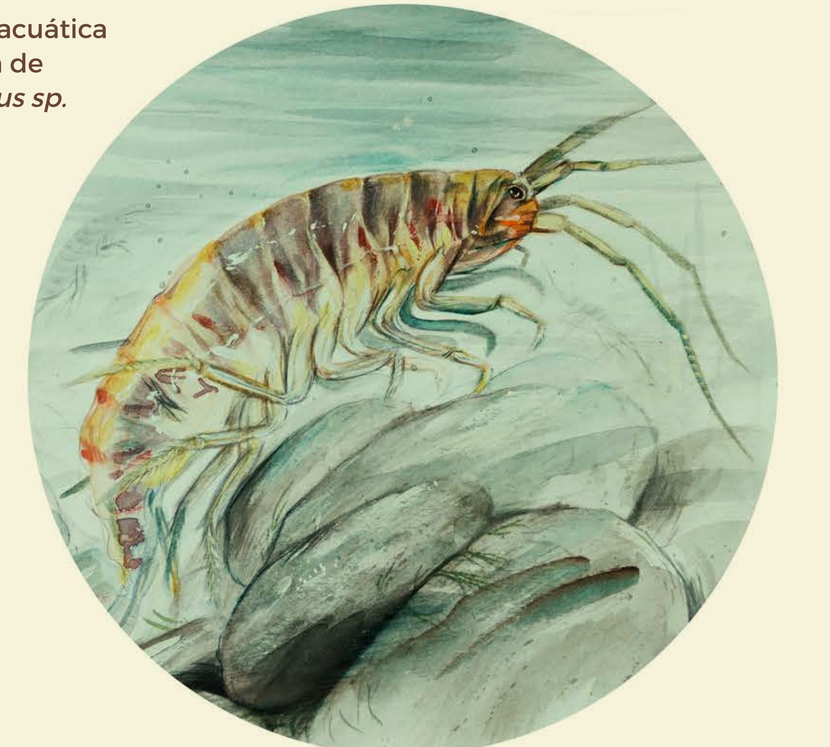
Vista subacuática ampliada de Gammarus sp.