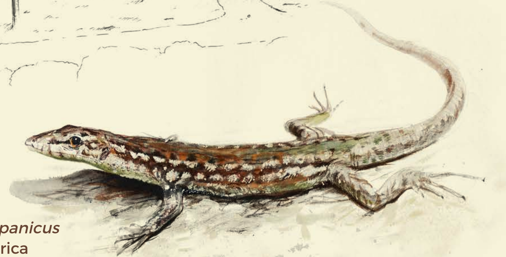
Podarcis hispanicus Lagartija ibérica