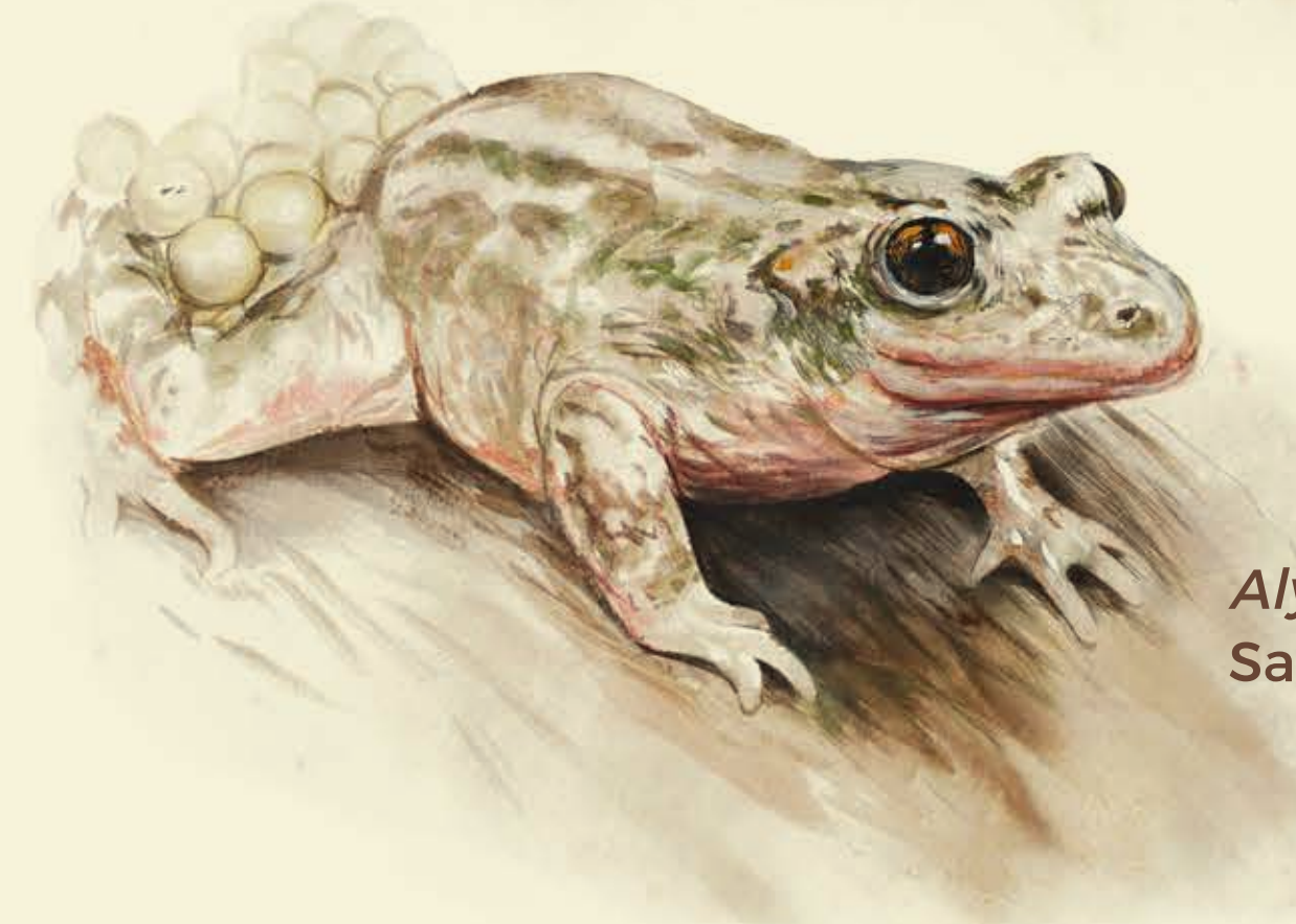
Alytes obstetricans Sapo partero