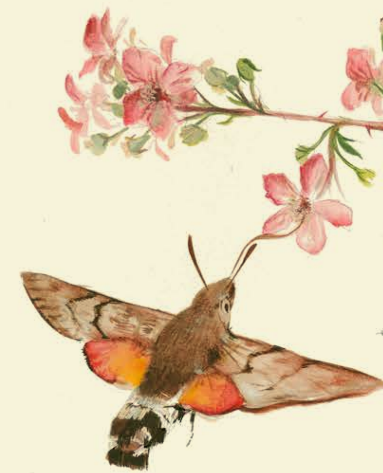
Macroglossum stellatarum Esfinge colibrí